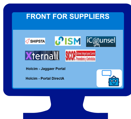
Imagen No. 2 - Ejemplo de Porta de Bienvenida.