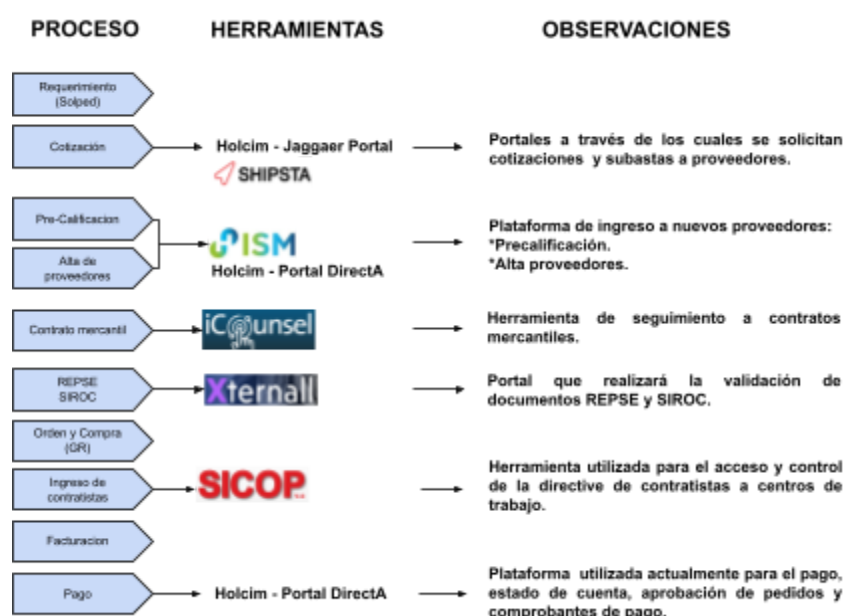
Imagen No. 1 - Proceso ASIS.

Algunas de estas plataformas hacen parte del grupo Holcim y otras hacen parte de diferentes vendor's; por lo que se debe acceder a diferentes páginas para contar la gestión de los procesos en las mismas.